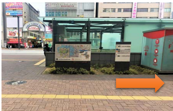
山陽百貨店出口から右方向へ