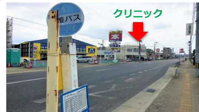
『競馬場前』で下車 振り返って『本 BOOK-OFF』右隣