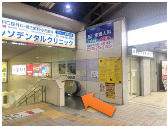
姫路城、大手前通りへ