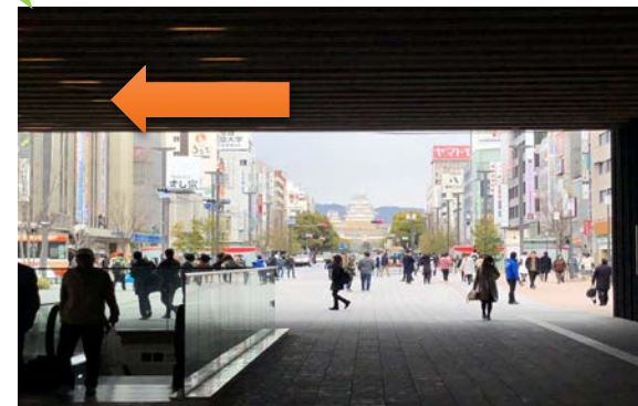
姫路城を正面に、信号を渡って 左側のバス停⑦,⑧番乗り場へ