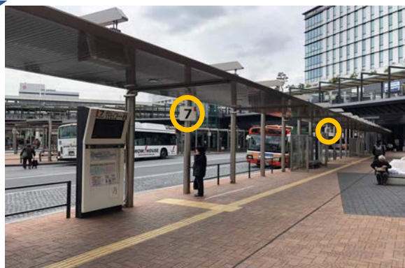
⑦,⑧番バスに乗車 どの目的地でも最寄りのバス停を通過します