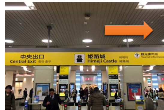
中央出口から姫路城方面(右側)へ